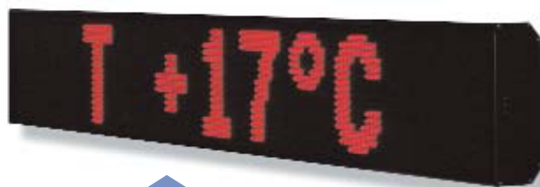
nuevos tipos de letra